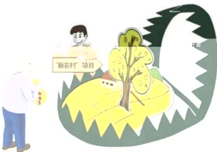
新型农业“发财树”， 圈钱坑农有陷阱

近期，不法分子打着“新型农业”的幌子，以高额回报为诱饵非法吸收公众存款，严重侵害群众财产权益。这类违法犯罪主要有两种形式：一是捏造“新型农业”概念，不法分子以“乡村振兴”“共享农业”为幌子，借助互联网欺骗农民；二是假借农民专业合作社、信用合作名义，部分农民专业合作社突破“社禁制”“封闭性”原则，以吸收资金为目的，将无实质性生产经营关系的人员吸收为合作社成员，骗取钱财。